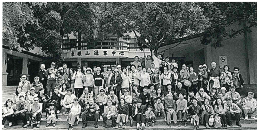
3/23 • 東眼山春季一日遊

耶和華的聖民哪，你們當敬畏他，因敬畏他的一無所缺。 少壯獅子還缺食忍餓，但尋求耶和華的甚麼好處都不缺。 詩篇 34:9~10